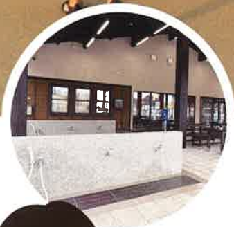
足洗い場はシャワー付き ビジターセンターの すぐ横だよ