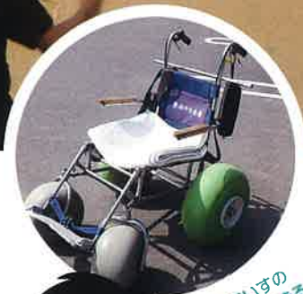
砂丘用車いすの貸し出しもできるよ