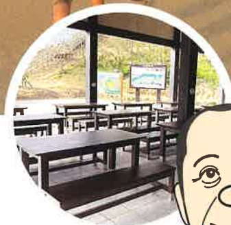
屋外休憩 スペースで お弁当が 食べれるぜ