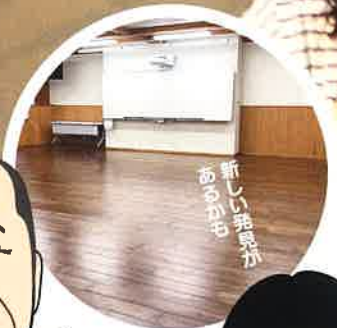
新しい勉強が あるかも