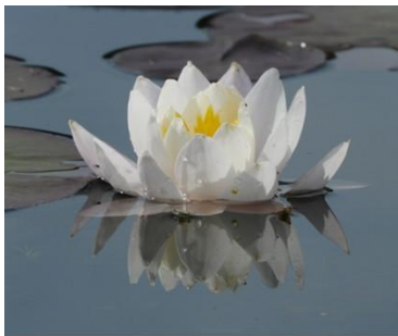
多鯰ヶ池のスイレン