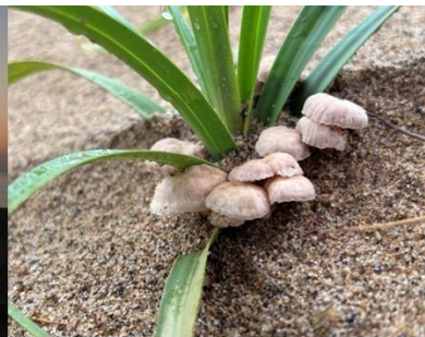
スナジホウライタケ